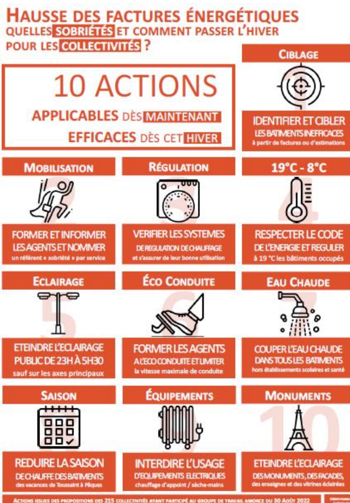
Schéma extrait du document « PLAN D'URGENCE SOBRIÉTÉ : 10 ACTIONS POUR AIDER LES COLLECTIVITÉS À PASSER L'HIVER ET AUTRES PISTES DE TRAVAIL » - septembre 2022

Pour cela, les communes peuvent être accompagnées par des conseillers indépendants mis à disposition à l'échelle des intercommunalités (cf. Bim'INFO n°214 septembre-octobre 2022, « La rénovation énergétique dans votre commune », page 7).